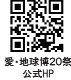
愛・地球博20祭 公式HP

期間中のイベントスケジュール、概要につきましては公式ホームページよりご覧ください。