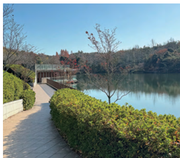
水辺の露台とかえで池