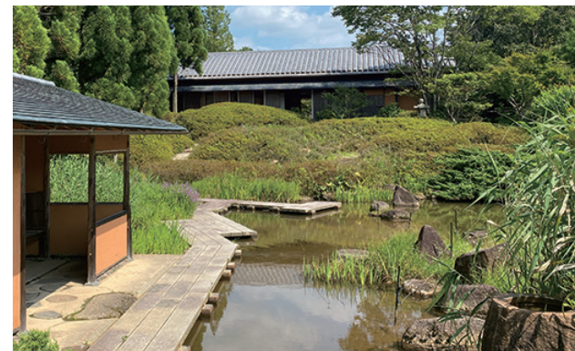
露地と茶室(写真奥) 外観