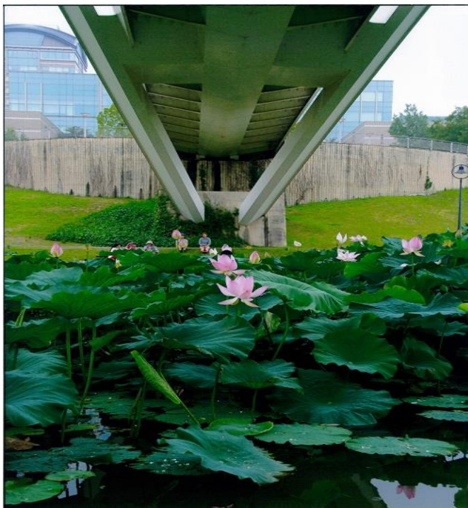
第8回公園フォトコンテスト協会賞 【集いの場】(あいち健康の森公園)