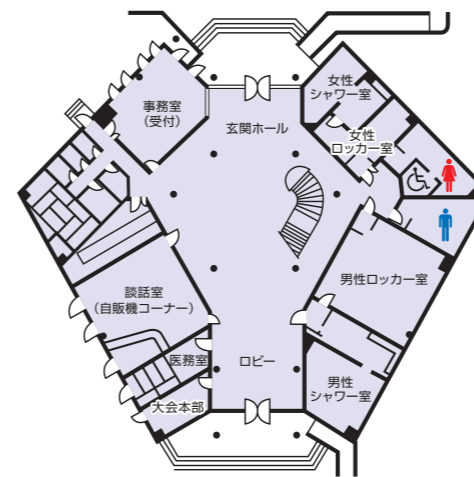
クラブハウス1階平面図