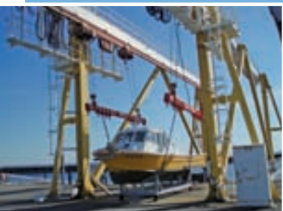
クレーンとハーバー救助艇