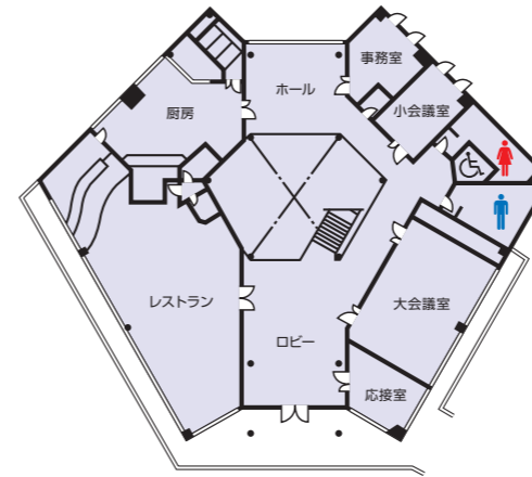
クラブハウス2階平面図